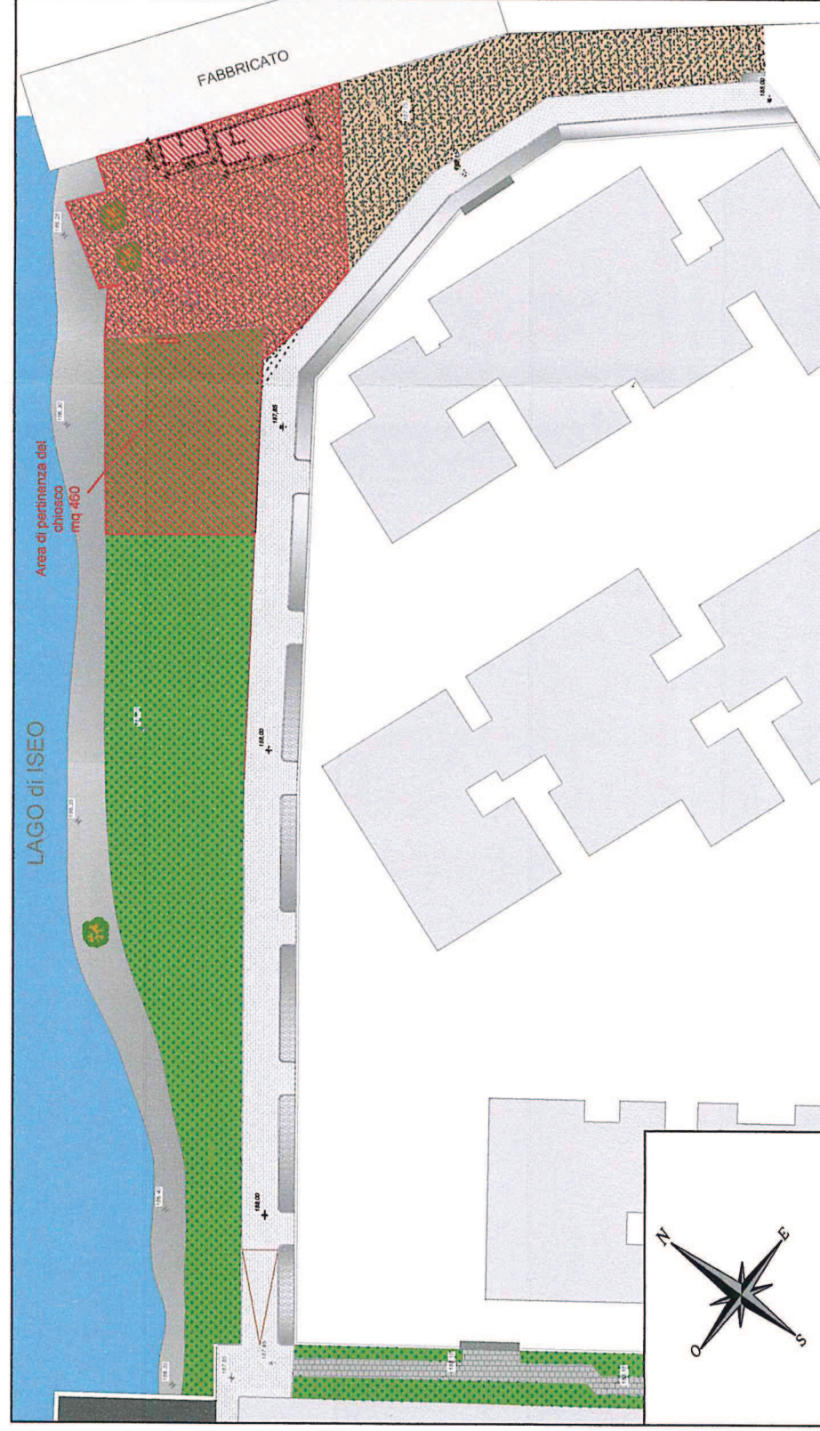
Planimetria generale scala 1:500

Area demaniale (mappale 57) Area di pertinenza al Chiosco mq 460