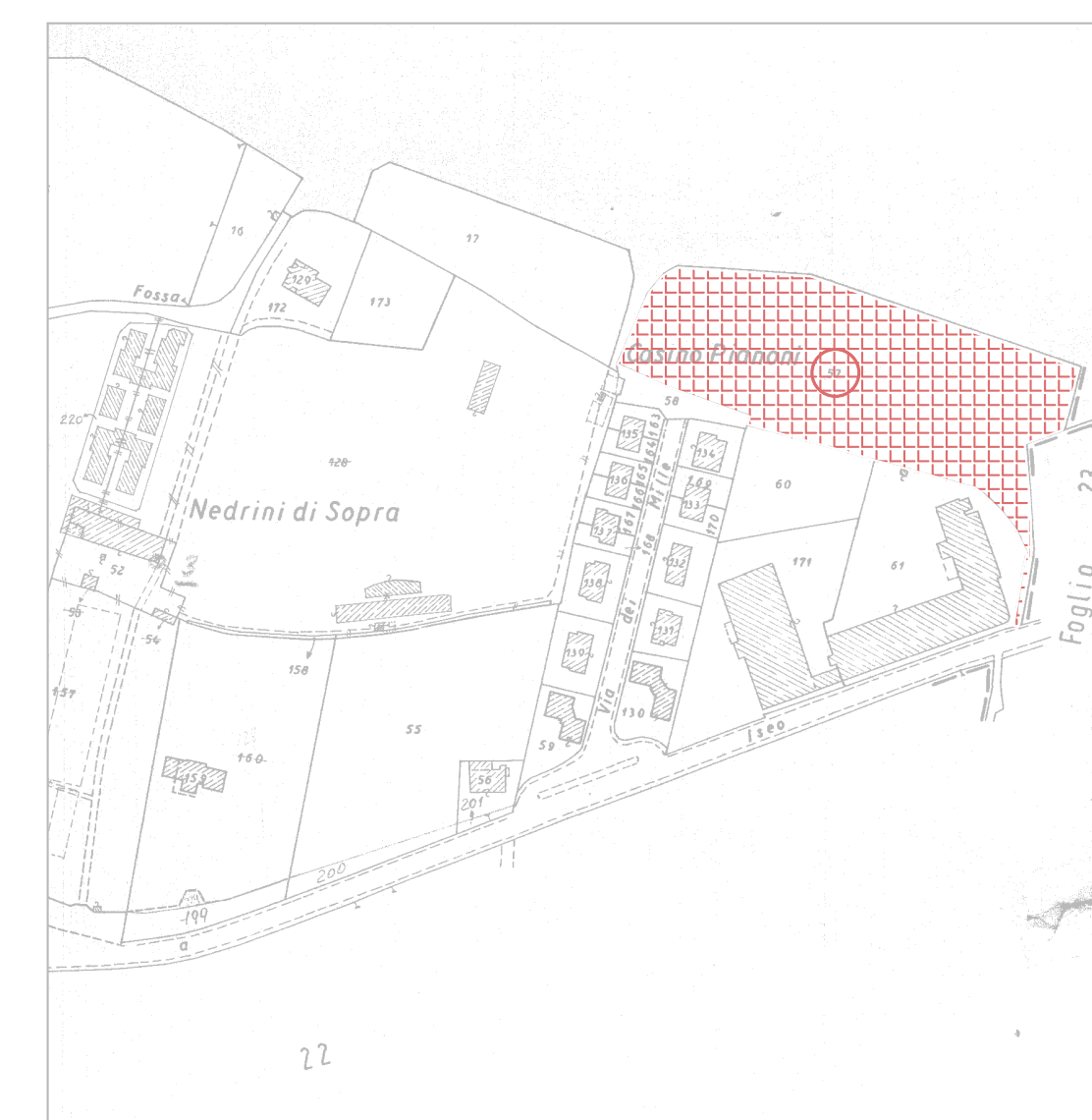
Estratto mappa - Fg. 20 mappale 57